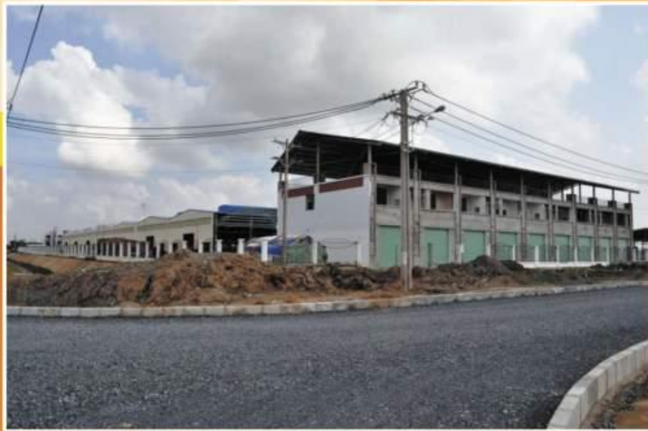
◀ Ji Xiang Yun project under construction