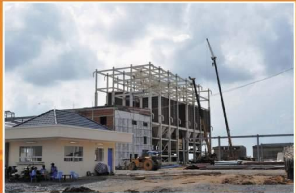
Sunjin project ▶ under construction